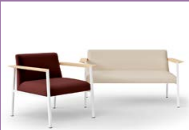
Lounge and conference chairs